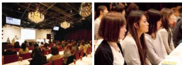
2011年1月に開催した「次世代会議」熱心に聞き入る社員

2011年度は、多様な働き方の実現に向けての環境作りや、世代間コミュニケーションを通じたキャリアアップモチベーションの向上などをテーマに活動を行っています。