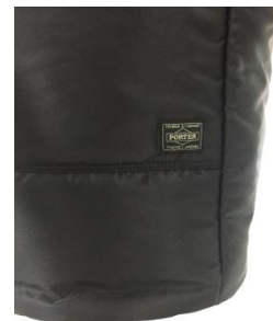
PORTERのネームはポケットに。カンパッチでカスタムするのが「あっこ流」