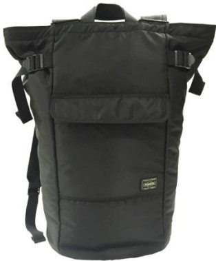
正面から。この形・この素材にこだわりました。 真ん中のポケットもポイント！ ※ポケットにはボタンが2個つきます。