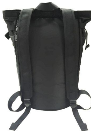
後ろから。使いやすいリュックタイプです。サイズ感は女子が背負ってバランスのよいサイズ。