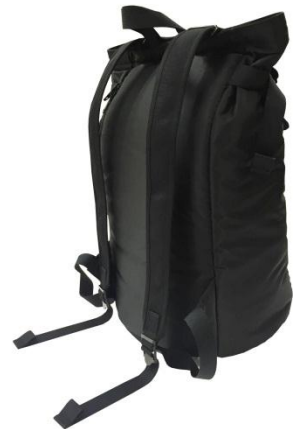
横から。ハンドルもついていて背負わなくても使えます。