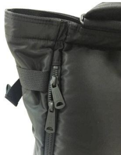
サイドのファスナーで背負ったままでも物の出し入れができます。