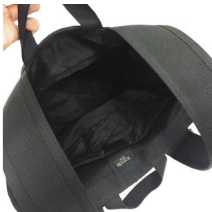
背負うとふたがしまる便利な構造。PC収納ポケットも！