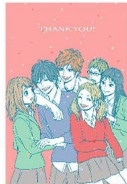
原作の高野莓先生による イラストを使用した グッズビジュアル例