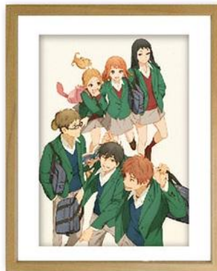
アニメキャラクターデザイン 結城信輝による 複製原画イメージ例