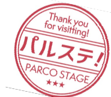
押印スタンプデザイン