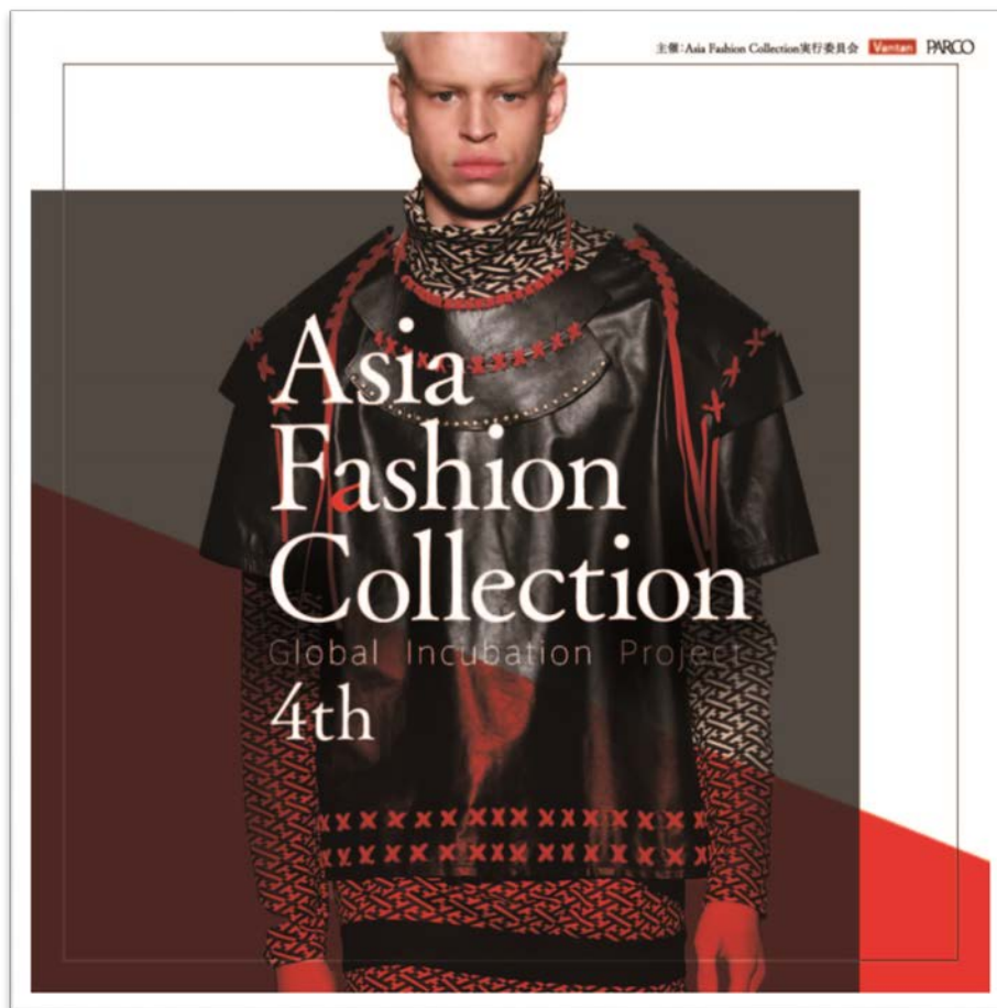
- AFC 4th (2016-2017) キービジュアル -

株式会社バンタン（本部：東京都渋谷区）と株式会社パルコ（本社：東京都豊島区）は、アジアの若手デザイナーを発掘・インキュベートするプロジェクト「Asia Fashion Collection（アジアファッションコレクション、以下 AFC）4th」の参加者を募集致します。AFCは、韓国、台湾、香港、そして日本の若手デザイナーが、ニューヨーク・ファッション・ウィークでのランウェイデビューをかけて競い合う“コンペティション”の要素と、その後、東京やアジアのファッションイベントへの参加機会提供、現役プロによるブランド独立のための実践的な支援などを通じてデザイナーの成長を促進する“インキュベーション”の要素を兼ね備えたプロジェクトで、今回で4度目の開催となります。