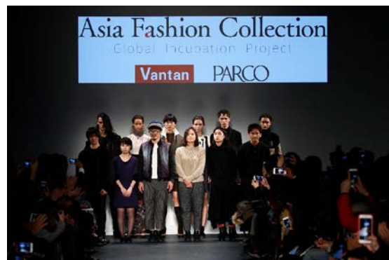
2016年2月14日 NY・ファッション・ウィーク