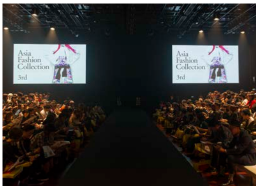
2015年10月19日 東京でのランウェイショー