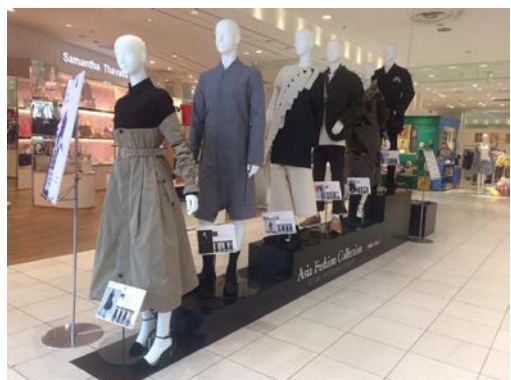
2016年3月5日～3月11日 渋谷パルコ作品展示