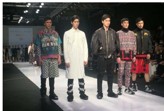
2016年4月14日～16日 タイペイ・イン・スタイル