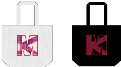
トートバッグ（2種） 各3,000円