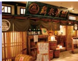
(左上)江戸時代にタイムスリップしたような店内で提供される銀しゃりがこだわりの和食居酒屋「舞米亭」

昨年から本格的なリニューアルとして、ファミリー向け衣料や子供服、ビューティ、雑貨といった幅広いラインナップを揃え、お客さまのニーズに応じてきました。2010年夏以降、ファッションとビューティテーマの充実や、アウトドア専門店「好日山荘」、環境と心地よい暮らしをテーマにしたセレクトショップ「アーバンリサーチドアーズ」、ホビークラフト「ユザワヤ」のオープンなどにより、さらなるバラエティアップと集客を図ります。