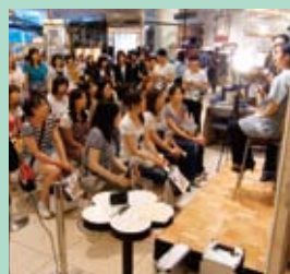
(左)2階インフォメーション横で行われたコスプレショーの様子 (右)2F正面口の吹流しが、仙台駅前商店街による飾りつけの審査で銀賞をいただきました

東北三大祭りのひとつ、旧暦の七夕に合わせて行われる仙台的七夕まつり。約200万人を動員し賑わうこのまつりに合わせ、仙台にゆかりのあるクリエイター集団による「クリエイターが創る、新しい仙台みやげ展2010」や、「七夕ワゴンセール」を開催。また、夏休み企画として「ポケモンセンターなつまつりin仙台PARCO」「カピバラさんmeets in 仙台PARCO by KIDDY LAND」などの期間限定キャラクターショップなどを展開し、ファミリー層や県外からのお客様も多くご来店いただきました。