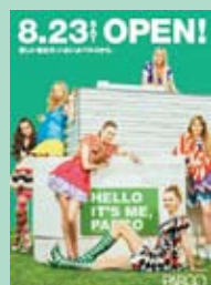
行き交う人々や集う人々が出会い、共感の輪を生み、街を奏でるライフスタイルビル。

2010 セレクトショップや、化粧品・雑貨・サービスといったアイテムの取扱いショップが売上を牽引し、2010年2月から7ヶ月連続で前年同期比売上高増を達成するなど好調に推移しています。仙台PARCOの顧客となる<PARCOカード>会員数も順調に増加しています。