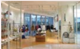
福岡PARCO 1F once A month™ <オールLED照明化店舗>

株式会社パルコスペースシステムズでは、環境負荷低減に配慮したオリジナル照明「P'es Lighting(ピースライティング)」の事業を展開し、設計・工事、導入後のメンテナンスまでを含めた複合的な提案でお客様に評価されました。