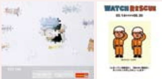
www.tictac-web.com/ ウォッチレスキュー

前年値に含まれる(株)パームガーデンは、2010年2月末にて直営店舗事業より撤退