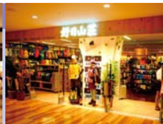
(右)登山・アウトドア用品店の「好日山荘」 (右下)毎日のお気に入り(MARKS)を提案する自然派化粧品・生活雑貨「マークスアンドウェブ」