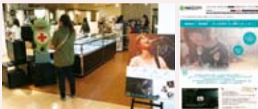
本年3月、映画「ソラニン」の公式ショップよりスタートした渋谷PARCO内常設ショップ

前年値に含まれる(株)ホテルニュークレストンは、2009年6月に全株式を売却し直営事業より撤退