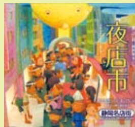
(左)夜店市告知ポスター (右)「静岡PARCO」入り口でのワゴンセール

活気のある静岡市中心部の商店街で、今年もお盆の時期に恒例の夜店市が行われました。夜店市とは、紺屋町名店街・呉六名店街・呉服町名店街・七間町名店街の4つの中央商店街が協力して行う催しで、商店街の各店舗が、自店の店頭にてワゴンセールやイベントなどを開催します。「静岡PARCO」も連動して入り口でのワゴンセールや全館での夏物最終処分セールを実施しました。