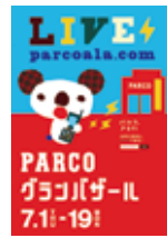
(左)各店のセールブログ (右)グランバザールポスター

RIP SLYME大博覧会 7月14日(水)~8月2日(月) 渋谷パルコファクトリーにてRIP SLYME初の展覧会を実施。その後、福岡・名古屋へ巡回し、メディアに多数取り上げられました。