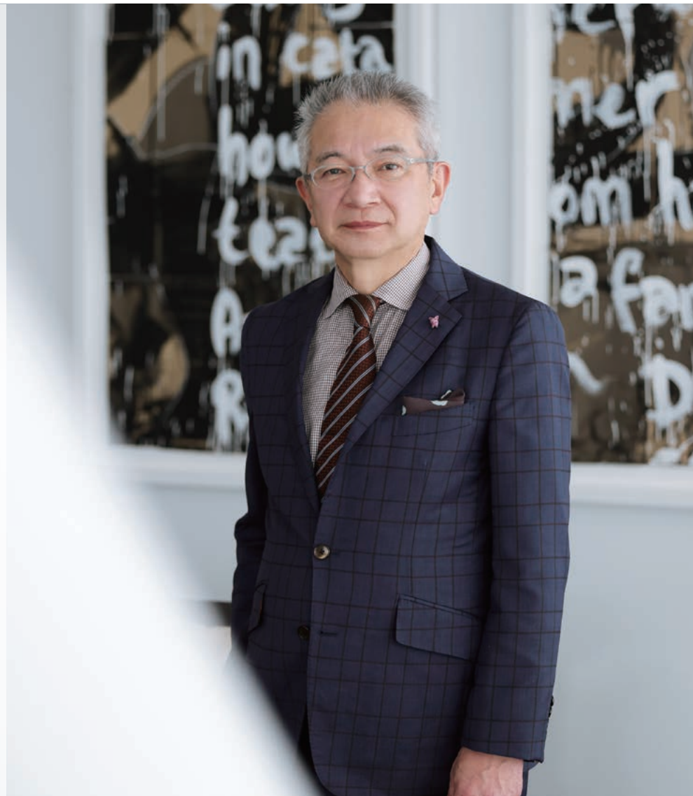
代表取締役兼社長執行役員