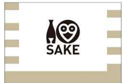
展覧会オリジナル枡