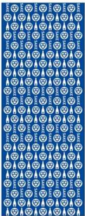
展覧会オリジナルてぬぐい