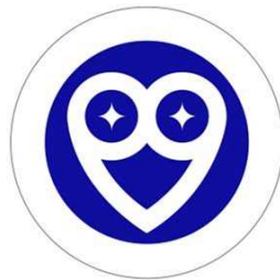
展覧会オリジナルお猪口