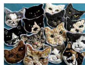
木之村美穂オリジナル 猫の刺繍作品 ハンドメイド1点物