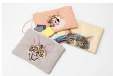
CAT In DA HOUSEのポーチ