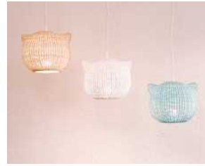
「KEORA KEORA」 ランプシェード