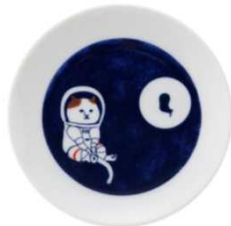
KOZACLAのネコイラスト皿/ハンカチ