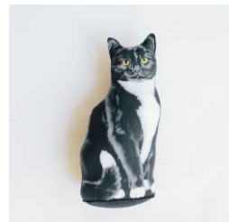
アメリカ製ドアストッ パー