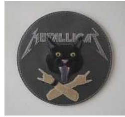
「HIGHCALORY OTOME」 黒のレザーパッチ