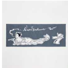
「新吉原」の手ぬぐい