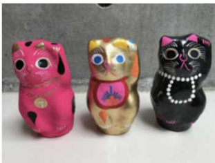
【限定コラボレーション】 POMPOMCAT×アトリエガング 幸せを呼び寄せる招き猫(3色)