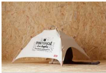
【限定コラボレーション】 猫用テント 41世紀 「#catstudyhouse」