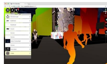
3D 空間作成ツール 画面イメージ

パルコでは、VR（Virtual Reality）や AR（Augmented reality）を活用した、次世代のショッピング体験について様々な企画を実施してきました。本セッションでは、参加者誰でも VR の 3D 空間を製作できるサービスを使って、自ら作った VR 空間の体験をしてもらい、VR/AR を使った新しいショッピング体験についてアイデアを競います。