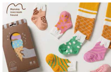
「Non'Z House/くつしたいつ」 生産地：日本