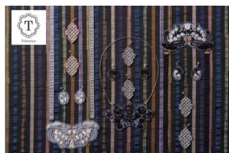
「トーホー/Beads Couture Jewelry」 生産地：インド ※ビーズ製造：日本（広島県）