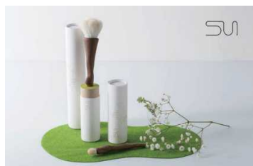
「晃祐堂/Kumano-Fude」 生産地：日本（広島県安芸群熊野町）