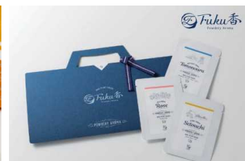
「Aroma RUB/パウダリーアロマ」 生産地：日本（広島県福山市）