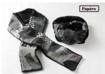
「福田手袋/パッチワークマフラー」 生産地：日本（香川県）