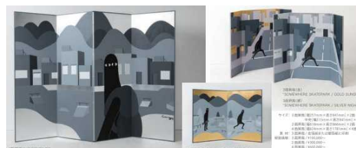
「泰山堂 / 金・銀屏風」 生産地：日本（広島県福山市）