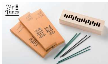
「孔官堂/Japanese Blended Incence」 生産地：お香/日本（兵庫県淡路市） 香炉/日本