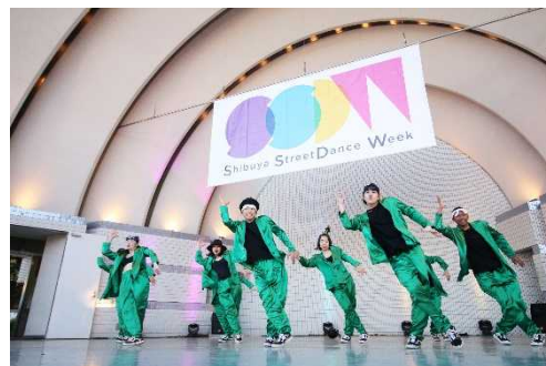
SSDW CONTEST (2017)