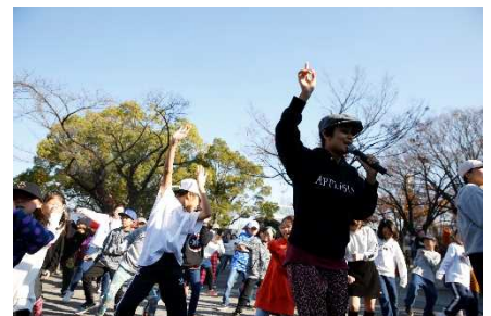
LECTURE SPOT (2017)