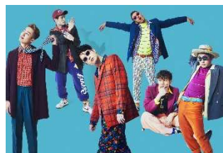
Beat Buddy Boi

Beat Buddy Boi 個性豊かなダンサー5名と、若くして10年のキャリアを持つSHUNのラップを武器にHIPHOPを「HIP“POP”」と変え、時にはCOOLに時にはFUNNYにお届けするHIPHOPエンターテインメント集団