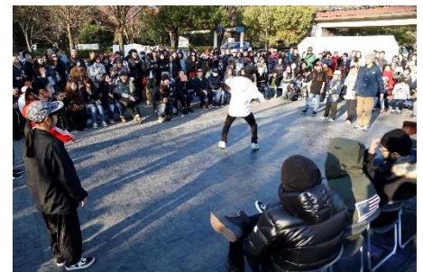
BATTLE PARK (2017)