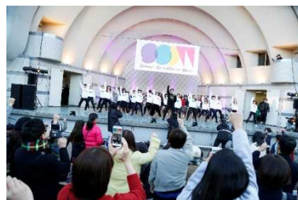
DANCE WITH music (2017)