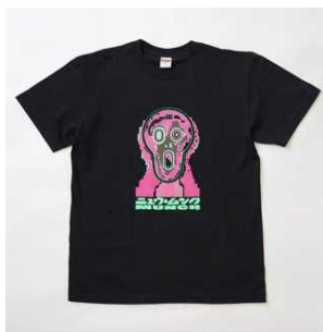
ニュームクTシャツ 3,500円(税抜)