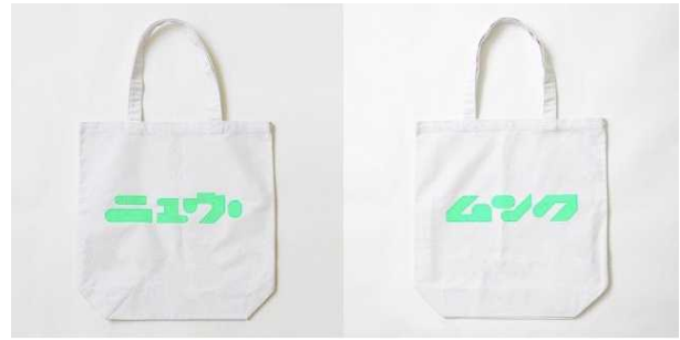
ロゴニュームックトート 3,000 円(税抜)