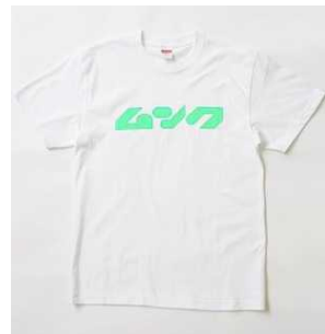
ロゴニュームクTシャツ 3,500円(税抜)