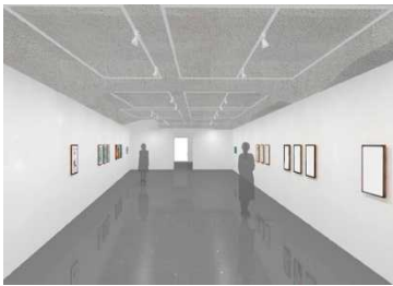
※「音の部屋：Infinite scream/インフィニットスクリーム」イメージ図