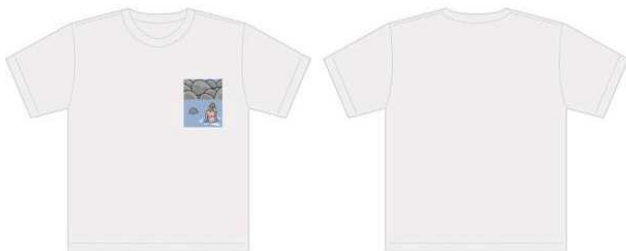
T シャツ (face) 3,000 円 (税抜)