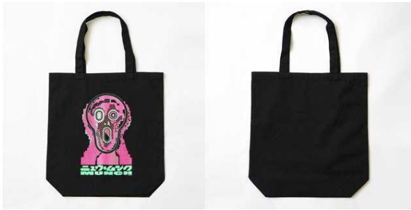
ニュームックトート 3,000 円(税抜)