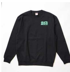
ニュームクスウェット 5,800円(税抜)