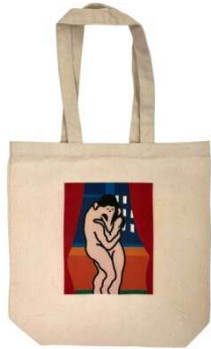
トートバッグ全 2 種 (とんぼせんせい、JUN OSON) 3,000 円 (税抜)