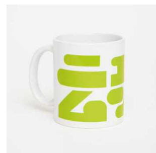
ロゴニュームクマグカップ 1,800円(税抜)