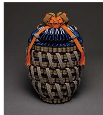
▲「獅子頭組紐呂宋壺」 RIBBONESIA×京真田紐師江南

作品は、一部を除きお買い求めいただけます。 また、ジークレープリントやオリジナル商品の販売も予定しております。