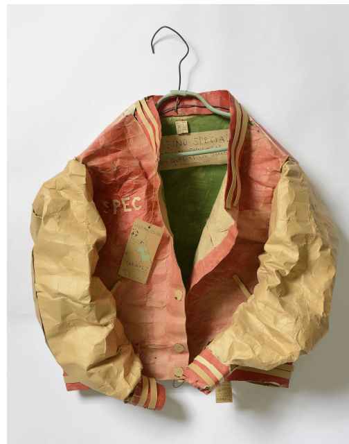
日比野克彦《SWEATY JACKET》1982年 岐阜県美術館蔵