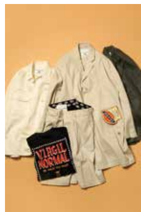
フリークス ストア/2F