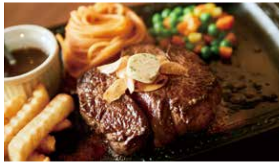
レストランカタヤマ 錦糸町グリル