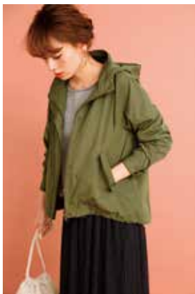
アーバンリサーチ サニーレーベル /2F

1階には新しい街の顔となるアフォーダブルラグジュアリーゾーンのほか、多層階にわたりメンズ・レディースの複合セレクトショップ、趣向性の高い専門店がそろいました。