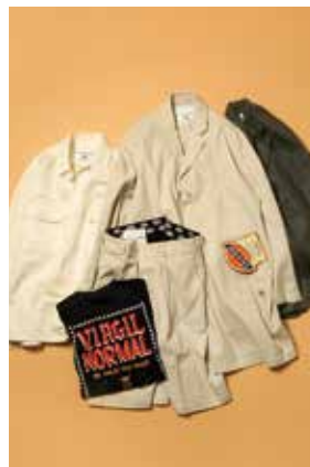
フリークス ストア/2F