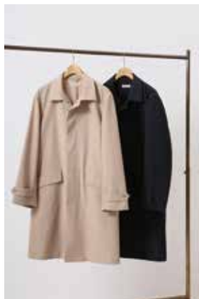
ジャーナル スタンダード レリューム/2F