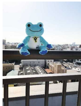
【池袋デザインピクルス】

今年生誕25周年を迎える「かえるのピクルス」とP' PARCOの25周年コラボレーションショップが期間限定OPEN。池袋デザインピクルス販売の他、3/23(土)にはピクルスが来店するグリーティングイベントも開催。