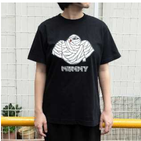
刺繍Tシャツ 黒/白 ¥5,940 (税込)