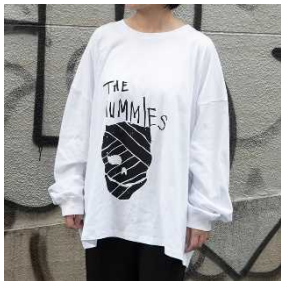
ロングTシャツ 黒/白 ¥8,470 (税込)