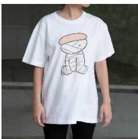
Tシャツ 歩いているミイラ 全3柄展開 ¥3,190 (税込)