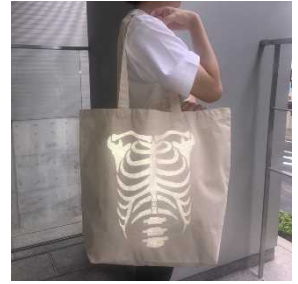
トート (フラッシュ前/後) ¥5,500 (税込み)