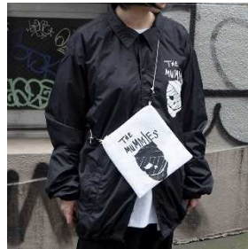
サコッシュ 黒/白 ¥3,960 (税込)