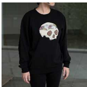
スウェット 骸骨/翼 全3柄展開 ¥5,390 (税込)