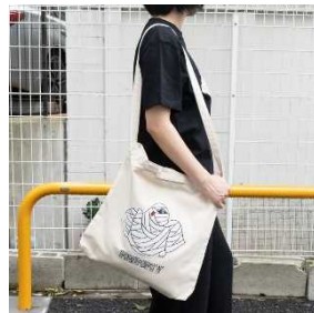
トート ¥5,940 (税込)