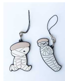
ラバーストラップ 歩く/寝る 各 ¥550 (税込)