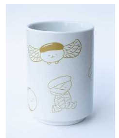
ゆのみ ¥1,210 (税込)