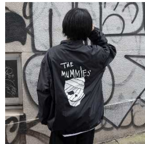
コーチジャケット 黒/白 ¥13,750 (税込)