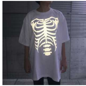
Tシャツ骨 (フラッシュ前/後) ¥6,600 (税込み)