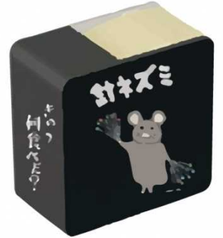
針ネズミ ポータブル付箋 ¥850