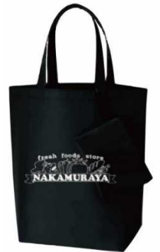
中村屋 ナイロンエコバッグ (黒) ポーチ付き ¥2,300