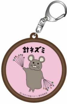
針ネズミ ラバーキーホルダー ¥650