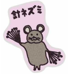
針ネズミ 刺繍パッチ ¥1,200