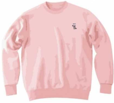
針ネズミ 刺繍スウェット ¥6,500