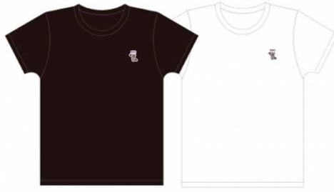
針ネズミ 刺繍Tシャツ (黒/白) 各¥5,300