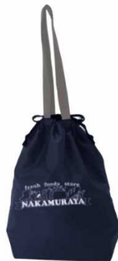
中村屋 巾着バッグ (ネイビー) ¥1,800