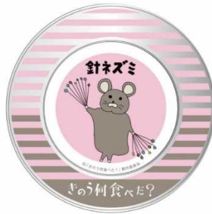
針ネズミ マグネット付きキャンディー缶 ¥1,000