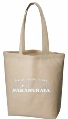
中村屋 シャンプリングマチ付トート ¥1,600