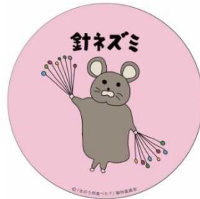
針ネズミ ミラー ¥900