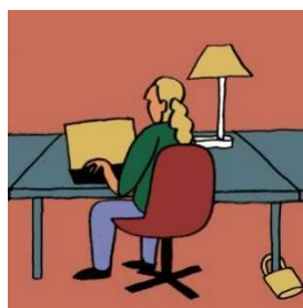
PRIVATE DESK 固定デスク