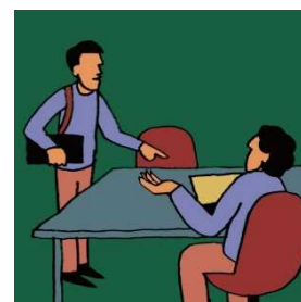
DROP IN ドロップイン