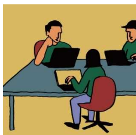
FREE ADDRESS フリーアドレス