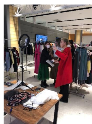
※写真は渋谷PARCO開催時の様子です。