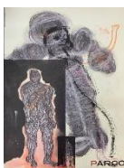
約32年間パルコの倉庫に眠っていた作品