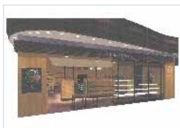
浦和コレクターズ

下期の14店舗中パルコ外部は 8店舗を出店。初の5事業部 同時出店など、積極的な新規 出店で、3年連続の二桁増収 増益を目指す