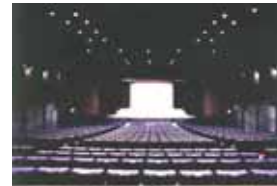
ル テアトル銀座 by PARCO 客席数770席

「パルコ劇場」に加え、規模の異なる二つの文化施設を運営。売上の直接貢献のみならず、公演ソフトのバラエティアップ、コンテンツ事業の拡大にも寄与