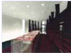
代官山sarugaku パークカフェイス