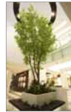
静岡パルコ内装 (地下1階吹き抜け部分)

静岡パルコの内装工事のみならず、静岡パルコやノースポート・モールの 出店企業、また外部百貨店からの工事受注や一般の既存・新規クライアント 企業の内装工事・電気工事の受注拡大により業績が向上。