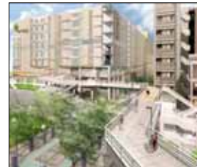
ノースポート・モール