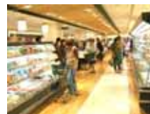
ひばりが丘パルコ クイーンズ伊勢丹

ひばりが丘パルコは、地下1階食品フロアを改装のため2月5日～5月29日の間、全面クローズいたしました。