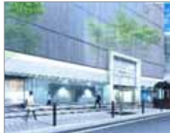
熊本パルコ 入口イメージ

改装規模：580区画 / 約56,000㎡予定 うち上期 26,000㎡実施 秋改装として20,000㎡を推進するとともに、来春の改装計画が進行中