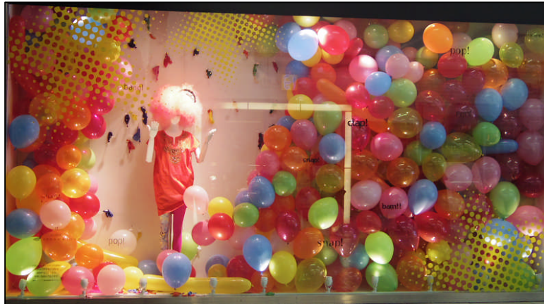
実際のウィンドウ/カラフルな衣装と装飾で夏らしい演出

内容: オシャレが好きでたまらない、オシャレ中毒(=fashion addict)な女の子「パル子ちゃん」がビタミンカラーのバルーンや洋服、雑貨に囲まれて、夏のファッションを紹介します。「パル子ちゃん」のしぐさを交えた演出で、夏のショッピングを楽しむワクワク、ドキドキする気持ちを表現しています。