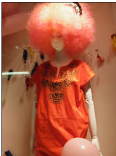
マネキン部分拡大