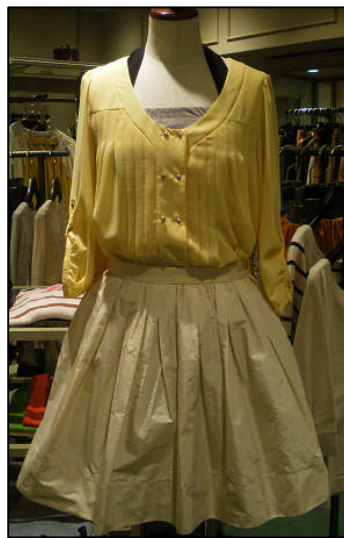
(左) フード付トレンチコート 44,100円 / パンツ (池袋PARCO) (中) ワンピース 16,800円 / ルージュウイファク (池袋PARCO) (右) スカート 15,750円 / ブラウス 14,700円 / ルージュウイファク (池袋PARCO)