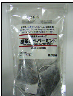
中国茶ティーパック 甜茶&ペパーミント 315円 / 無印良品 (渋谷PARCO店他)

日常的に口にする飲み物も、抗アレルギー効果があるとされている「甜茶」(てんちゃ)に切り替えたり、いつもの紅茶にハチミツの中でも栄養価が高く免疫力をあげるといわれている「マヌカハニー」を入れて、花粉症対策をすることもできます。症状が出る前に予防策として摂取すると良いようです。