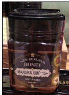
マヌカハニー 4,200円 / ペパーハニー (池袋PARCO)