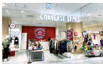
名古屋PARCO 西館1階 メンズ・レディース・雑貨「コンバース スターズ」

※1 CRMとはCustomer Relationship Managementの略であり、顧客情報を管理することで顧客満足度を向上させるマネジメント手法です。 ※2 モバイル決済や海外発行クレジットカード等取扱高は、既存店の取扱高を比較するため、錦糸町PARCO、宇都宮PARCOの値を含みません。