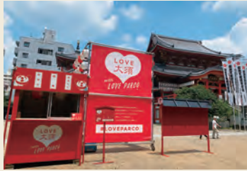
2019年7月30日～8月4日 大須観音境内の特設ブース

名古屋PARCOは、1989年6月に開業し、30周年を迎えました。2019年5月より30周年キャンペーン「LOVE PARCO」を展開、さまざまな愛をテーマにしたメッセージ広告では、地元で暮らす10組の「LOVE」の形を名古屋PARCO館内や名古屋市内で撮影し表現しました。7月には大須商店街とコラボレーションして、日本三大観音のひとつである大須観音境内に特設ブースを設けた「LOVE 大須 with LOVE PARCO」を開催するなど、LOVEにまつわる企画を多数実施。「30年間の感謝の気持ち」や賑わいへの貢献といった思いのもと、年間を通して、地元の方々と一緒に盛り上げています。