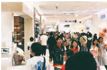
開店時の混雑の様子