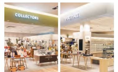
2019年6月27日オープン サンエー浦添西海岸 PARCO CITY 2階 左:メンズ雑貨専門店「コレクターズ」 右:眼鏡専門店「ボーカールフェイス」

株式会社パルコデジタルマーケティングは、商業施設向けWebサービス「PICTONA(ピクナ)」とデジタルサイネージの複合サービスを展開し、外部クライアントの新規受託を増やしたことにより営業収益は前年同期実績を上回りましたが、事業拡大のための人件費、開発費増により営業利益は前年同期実績を下回りました。