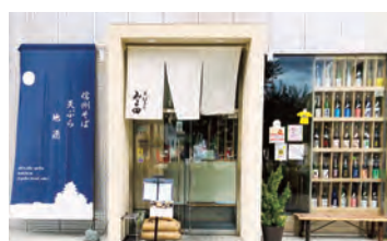
松本PARCO 1階 そばなど信州のお料理と日本酒「みよ田」