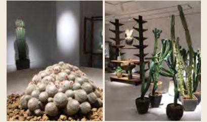
2019年5月16日～6月3日 25周年記念展覧会 『叢-Qusamura展～騒(ざわ)めく植物の声～』

広島PARCOは、1994年4月に開業し、25周年を迎えました。25周年キャンペーンモデルには、広島出身のクロちゃん(安田大サーカス・本名:黒川明人)を起用し、ビジュアル掲出やTVCM、YouTubeなどで25周年をアピール。2019年5月に開催した「25周年感謝祭PARTY SALE」では、地元の植物屋による展覧会など感謝の気持ちを込めて広島の方々と協業したイベントや期間限定ショップなどを展開しました。また、9月には広島PARCOオリジナル企画となる、クロちゃん初の展覧会イベント「クロちゃんのモンスターパーク」を開催するなど、マーケットの賑わいに貢献し地元の皆様により愛される店舗を目指していきます。