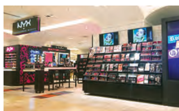
池袋PARCO 本館地下1階 コスメ「NYX PROFESSIONAL MAKEUP」