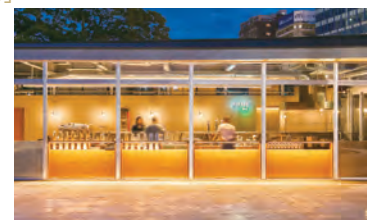
TOFFEE park (福岡県福岡市) 照明設計を受注