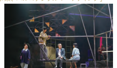
2019年2月24日～3月17日 「世界は一人」