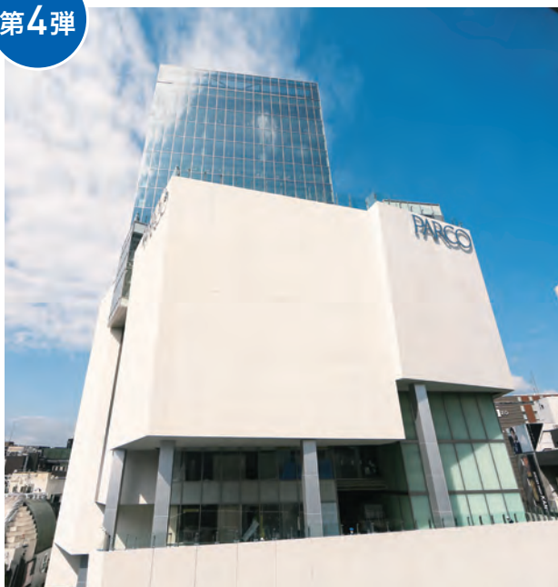
公園通り側外観(2019年8月撮影)