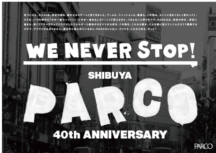
40 th キャンペーンビジュアル