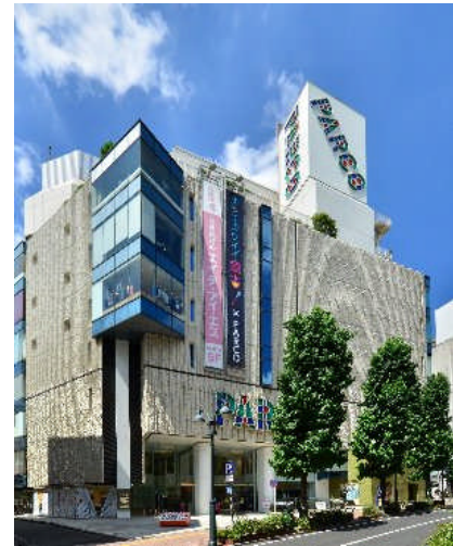
渋谷パルコ パート1 外観