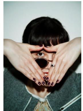
渋谷PARCO、池袋PARCO 「ヴォーティング イエス バビロン」

※PARCOの春の改装は全国PARCO 19店舗にて2月～5月にかけて展開いたします。