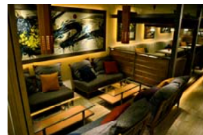
こだわりのウォールアートとオリジナル家具で、くつろぎの空間を演出