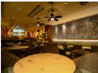
質の高い内装デザインを強みに 20～30代女性から高い支持を獲得