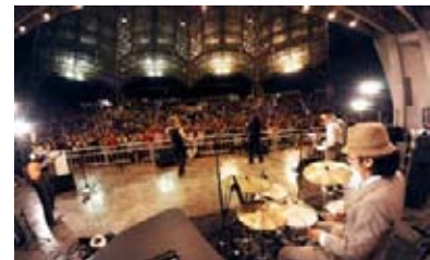
2007年から毎年、野外音楽フェスティバル 「夏びらき」を主催