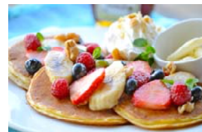
和TEISHOKU、和NOODLE、和SWEETSなど種類豊富なメニューを用意

今後も、パルコ運営施設へ飲食店舗の出店を更に拡大していくことや、両社の強みを活用した飲食店舗や業態の開発、両社が共通し取り組んでいるエンタテインメント事業やメディア事業といった領域においてシナジー効果を創出していくことで合意しています。