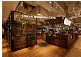
2012年11月にオープンした渋谷 タワーレコードカフェをプロデュース