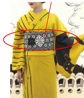
(左) ねこ柄浴衣 36,750 円 (右) 花柄浴衣 30,450 円/ふりふ (渋谷パルコ、池袋パルコ)