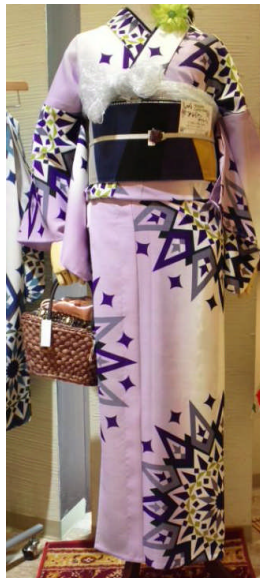
(右) エスニック柄浴衣 31,500 円/しゃら (池袋パルコ)

ファッションのトレンドを汲んで、「エスニック柄」が浴衣にも登場しました。古典柄では物足りない方におすすめです。