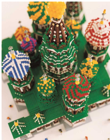
ロシア モスクワのクレモリンと赤の広場(レゴ®ブロック作品:聖ヴァシーリー聖堂)