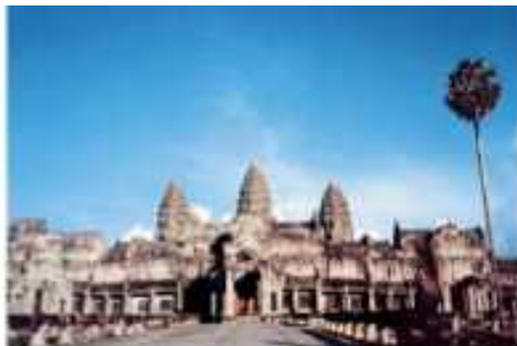
カンボジア王国／アンコール