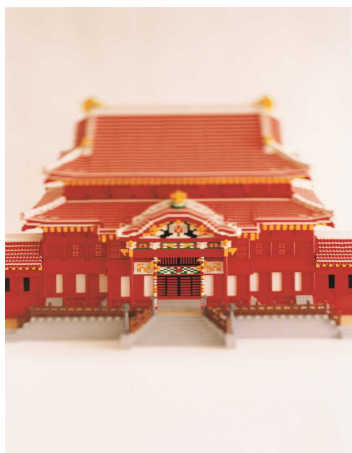
日本国 琉球王国のデスク及び関連遺産群(レゴ®ブロック作品:首里城)