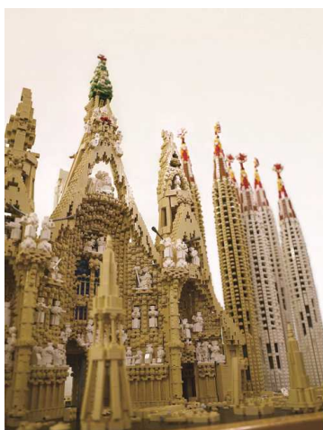
スペイン アントニ・ガウディの作品群(レゴ®ブロック作品:サグラダファミリア)