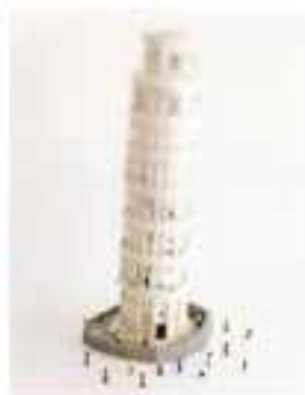
世界遺産モデルビジュアル各種