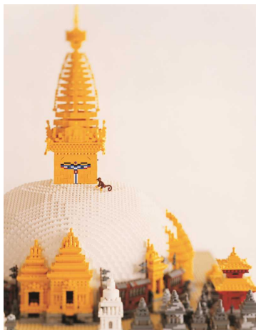
ネパール連邦民主共和国 カトマンズの谷(レゴ®ブロック作品:スワヤンブナート寺院)