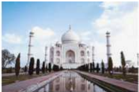
インド／タージ・マハル