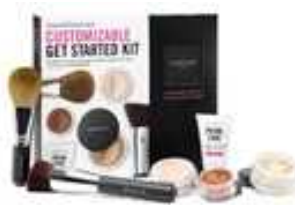
2F・ベアミネラル 「ベースメイク スターターキット」 2種販売