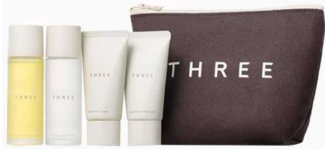
2F・THREE 「限定商品「THREE トライアル キット BL-a」