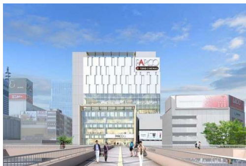
「仙台パルコ2」外装イメージ（昼）