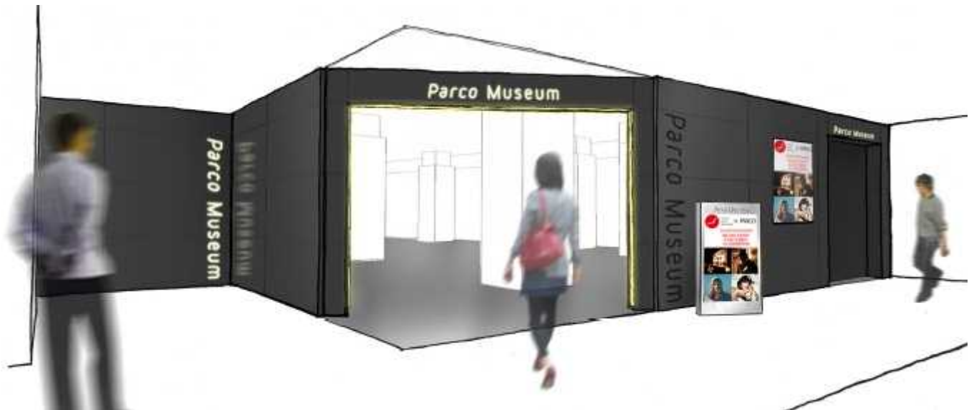
※池袋「パルコミュージアム」エントランスイメージ

池袋「パルコミュージアム」のオープニングを飾るのは、漫画家・安野モヨコの全仕事を網羅する初めての大規模個展。同時刊行の作品集は、展覧会場先行発売となります。