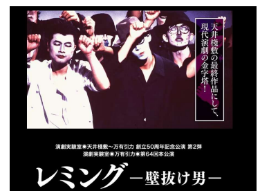
● レミング スペシャルパッケージ