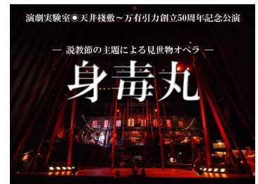
● 身毒丸スペシャルパッケージ