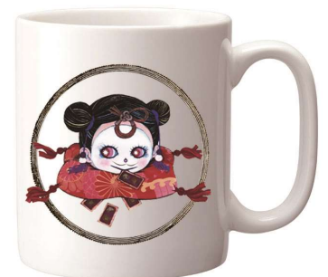
● 劇団イヌカレーコラボマグカップ