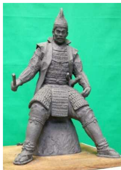
今川義元公銅像イメージ