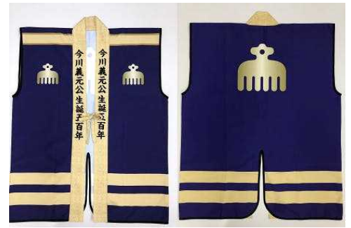
③特製今川陣羽織 30,000円 ※①もセットです。