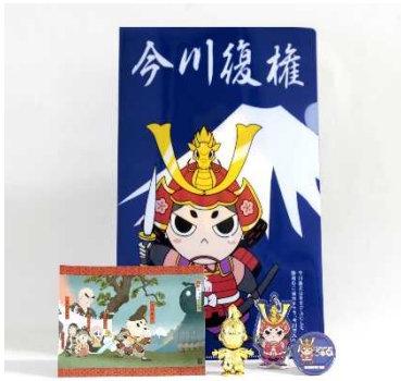
①今川さんグッズ詰め合わせ 5,000円 (クリアファイル/ポストカード/プラモデル/ キーホルダー/缶バッジ)