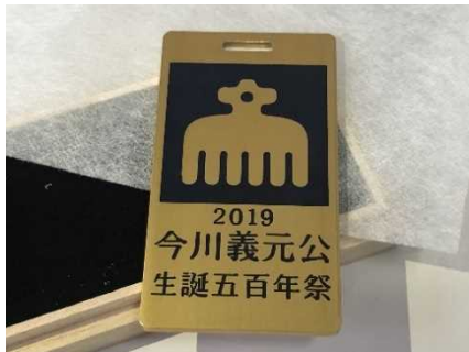
④アルミ製ネームタグ 50,000円 名前を刻印 ※①もセットです。