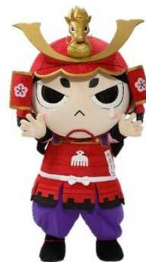
静岡市非公認キャラクター今川さん

今回、クラウドファンディング「BOOSTER(ブースター)」を通じて支援を募集、返礼品には歴史ファンにはたまらないお宝グッズも準備しました。