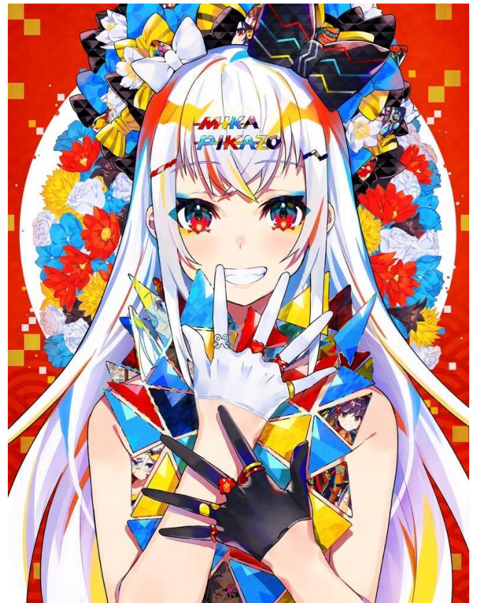
展示会メインビジュアル