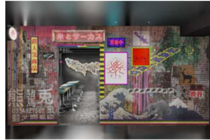
B1F「米とサーカス」イメージパース