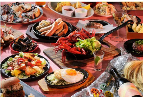
B1F CHAOS KITCHEN