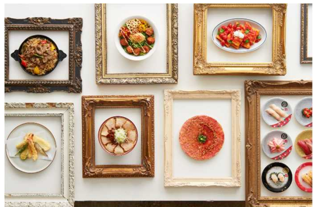
7F RESTAURANT SEVEN