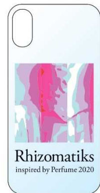
スマートフォンケース 2,800円