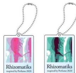
アクリルキーホルダー(2種) 各600円