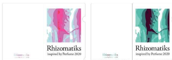
クリアファイル(2種) 各400円