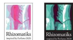
ステッカー(2種) 各300円

※内容についての追加詳細情報は、 展覧会公式サイト<art.parco.jp> にて随時発表致します。 ※税抜価格となります。