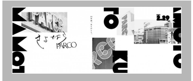
限定「手ぬぐい」（サイズ）W:900×H:350