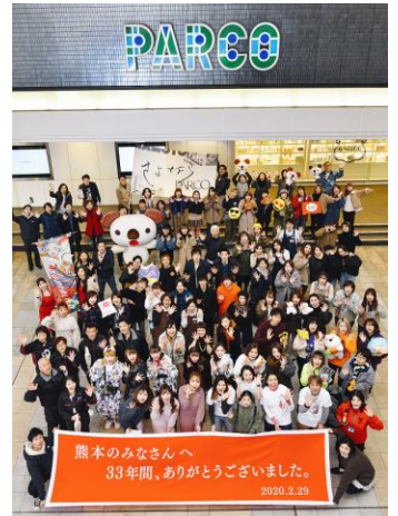
45組目「熊本パルコ オールスタッフ」

熊本パルコ オールスタッフで、ご愛顧頂いたマーケットの方々への謝恩の気持ちを込めて、最後のその日まで、一同悔いの無いよう、全力を尽くして参ります。