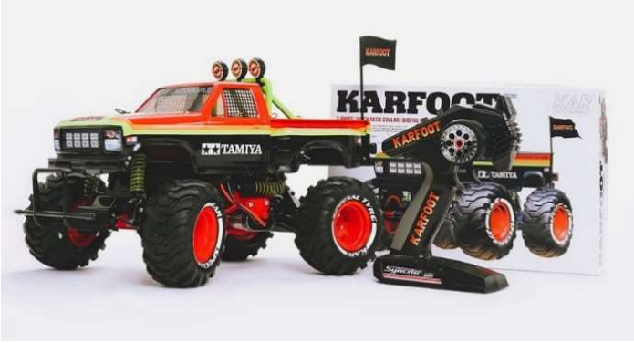
左上：KARFOOT BOX デザイン・右上：KARFOOT RCカー ※RCカーの販売はございません。