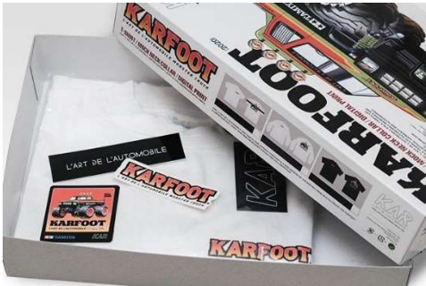
※特製 BOX・ノベルティステッカーが 付属いたします。

写真上・中) KARFOOT GRAPHIC TEE (WHITE・BLACK) - TAMIYA EDITION ¥13,200 (税込)