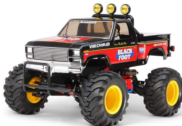
写真左上：BLACKFOOT (2016) BOX・右上：BLACKFOOT (2016) RCカー本体