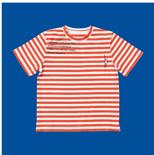
「なつ」Tシャツしましま 赤、青 (1サイズ) 7,200円+税