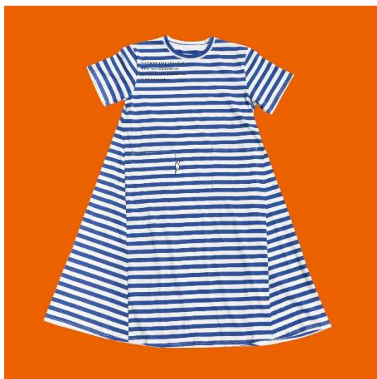
「なつ」ワンピースしましま 青 (1サイズ)