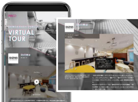
バーチャルツアー（オンラインで心齋橋 PARCO を体感）