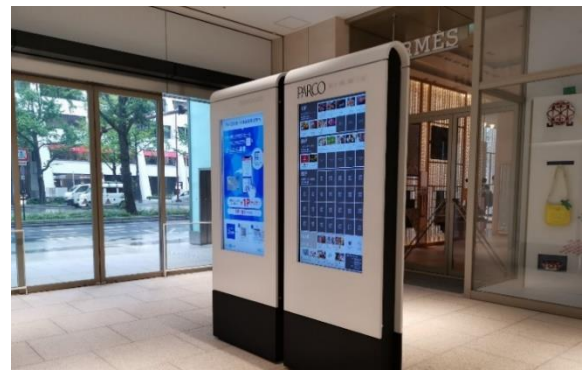
1階 風除室 デジタルサイネージ（館内全 24 拠点に導入）