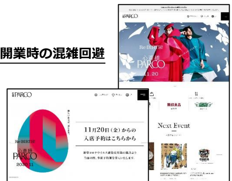
心齋橋 PARCO Web サイト