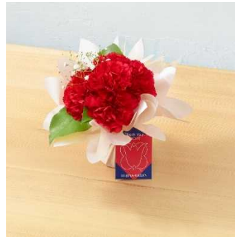
日比谷花壇 シュシュフルール「サンキューマ ムルージュ」