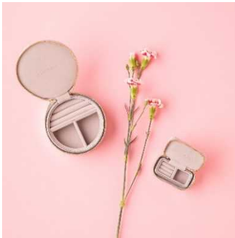
UNITED ARROWS 「STACKERS ジュエリーボックス」