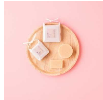
ROSEMARY 「リルレシピ フェイスソープリッチ ラベンダーハニー 特別ラベル」