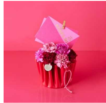
青山フラワーマーケット 「ドレープ (Sサイズ・フューシャ)」

「ふと、ギフト。パルコ」特設サイト https://www.ozmall.co.jp/especial/article/27304/ ※緊急事態宣言の発令に伴い一部店舗は臨時休業いたしております。詳しくは各店舗のHPをご確認ください。