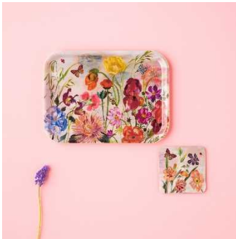
H.P.DECO アート感のある暮らし 「ミニトレイ フラワー/ コースター ポピー」