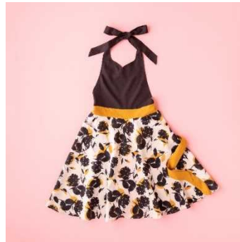
Francfranc 「シルエ フルエプロン」