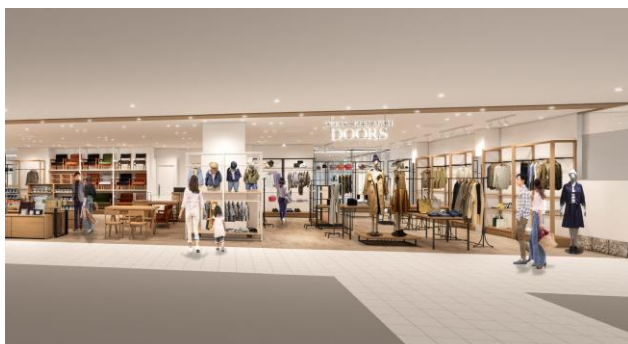
2F・URBAN RESEARCH DOORS

毎日のおしゃれにも、特別なシチュエーションにも、テンションをあげてくれるアクセサリ。1Fには「ANEMONE」、「Jouete」が浦和エリアに初登場します。“ミレニアル世代”を中心に幅広い層の個性を彩ります。