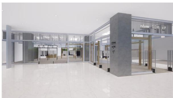
1F・JOURNAL STANDARD relume / SLOBE IENA / 417 EDIFICE

2F「URBAN RESEARCH DOORS」は増床リニューアルでキッズ・雑貨などのMDバラエティを拡充し、親子で楽しむアイテムを提案いたします。