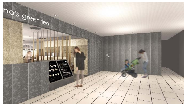
2F・nana's green tea

2F「nana's green tea」は、ベビーカーをご利用のファミリーにもお使いいただきやすいカフェとして増床リニューアルします。新たにできる小上り席は、コルクタイルを使用。サステナブルかつコロナ禍において重要な掃除のしやすさも兼ね備え、安心してご利用いただくことができます。ファミリーの利用を見越し、入口にはベビーカー置き場を設置します。