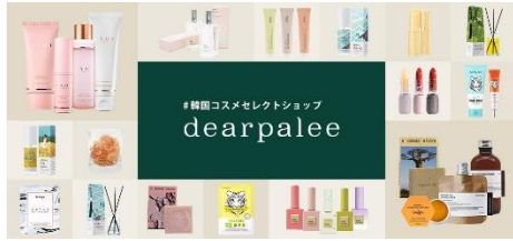
本館B1F dearpalee【韓国コスメ】 期間：9月16日(金)～10月11日(火)

コスメを中心に韓国の厳選アイテムを揃えるセレクトショップ。ファッション誌にも取り上げられる人気急上昇中のアイテムや話題のオーガニック・ヴィーガンブランドなど、韓国コスメの最新線をお届けします。【関東初出店】