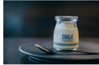
本館B1F CHILK【チーズケーキ】 期間：10月7日(金)～10月16日(日)

コスメを中心に韓国の厳選アイテムを揃えるセレクトショップ。ファッション誌にも取り上げられる人気急上昇中のアイテムや話題のオーガニック・ヴィーガンブランドなど、韓国コスメの最新線をお届けします。【関東初出店】