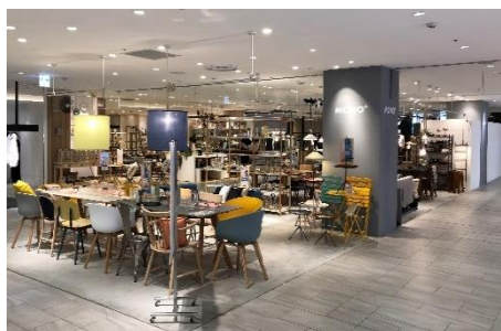
※店舗イメージです