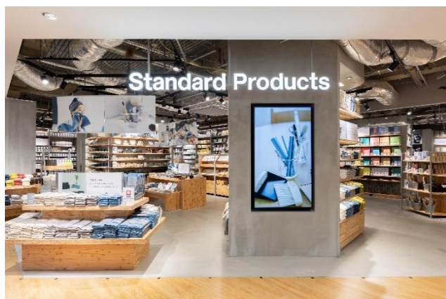
※他店舗イメージです