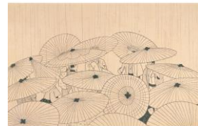
小村豊信《おせん》埼玉県立近代美術館蔵 ※プリントイメージ

③埼玉県立近代美術館×浦和PARCO オリジナルトートバッグ <引換期間> 10月21日(金)~23日(日)