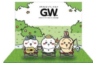
▲「ちいかわ」フォトブース（5F・特設、5/7迄）