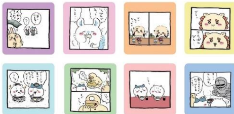
▲「ちいかわ」お食事シーンコースター