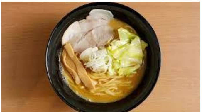
ラーメンにしかわ