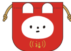
巾着 ¥2,420 (税込)