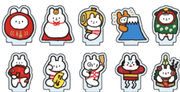
アクリルスタンド 各 ¥660 (税込)