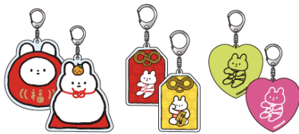
アクリルキーホルダー 各 ¥1,650 (税込)