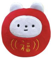
ぬいぐるみ ¥3,850 (税込)

販売商品の一部をご紹介します！ ※商品内容は予告なく変更になる可能性があります。