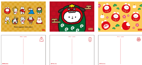
左：キラキラポストカード ¥440 (税込)