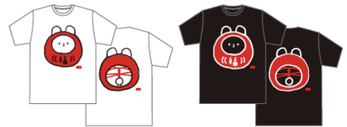
Tシャツ 各 ¥5,500 (税込)